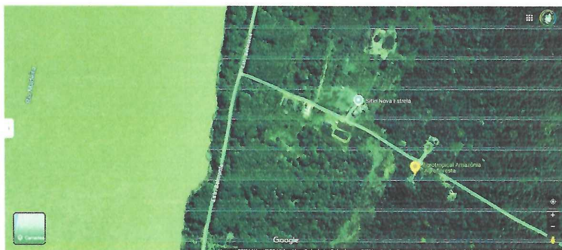
Figura 1 Visão aérea da Agrotropical Amazônia.